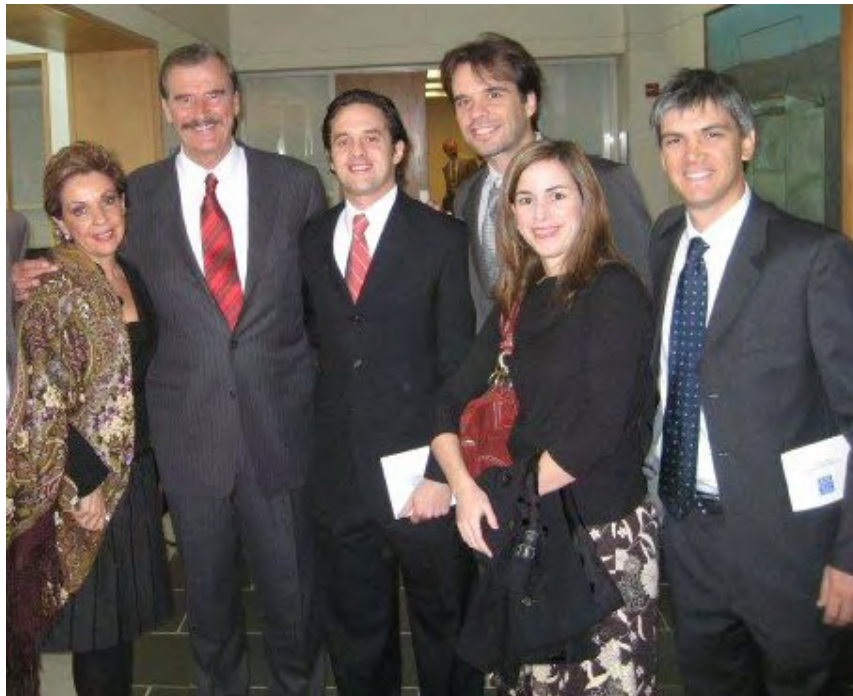
Visita del Ex Presidente de México Sr. Vicente Fox.

Durante las fiestas de fin de año he decidido recorrer un poco EEUU. Espero que sean unas vacaciones inolvidables!!!